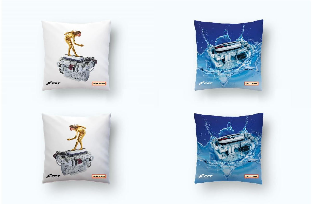
Cojines de la colección cápsula de Seletti

Colorido, innovador, único: estos objetos representan una nueva dirección para FPT Industrial que continúa navegando por el mundo del arte, claramente lejos de su hábitat natural, industrial, y que le infunden ideas innovadoras a la marca eligiendo un socio irreverente, inteligente y profundo a la vez como es Toiletpaper de Maurizio Cattelan y Pierpaolo Ferrari.