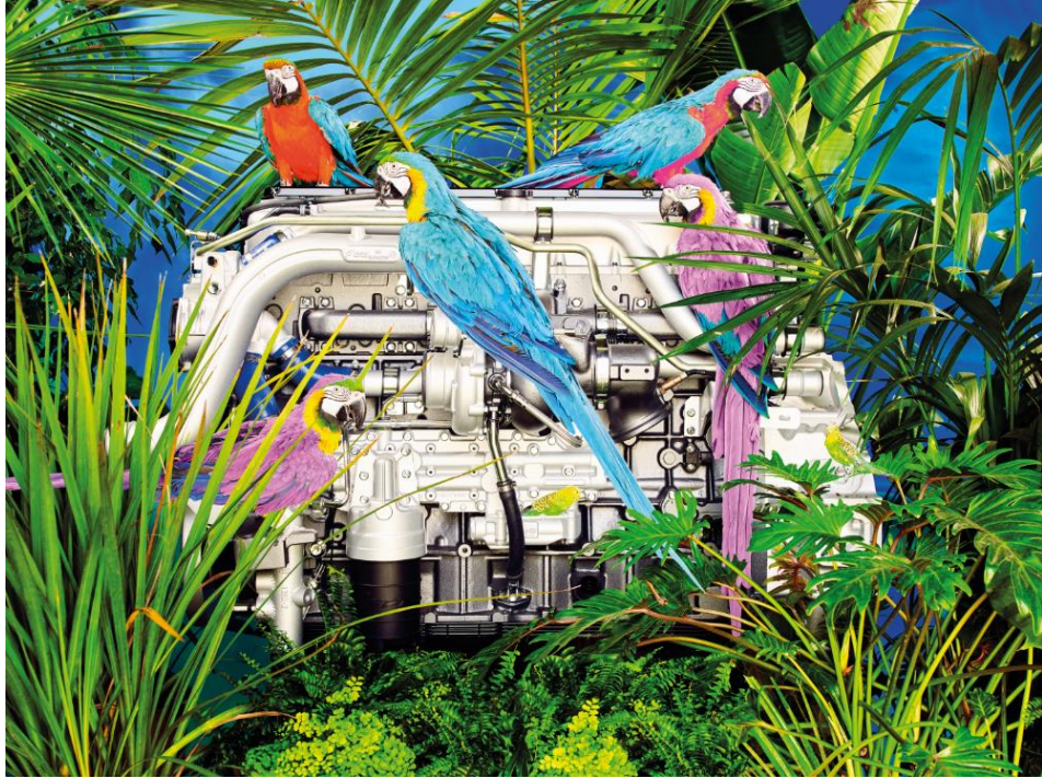
El motor Cursor 13 de gas natural presentado en un entorno sostenible por Toiletpaper

Cattelan y Ferrari lo explican: "Siempre nos ha asombrado la potencia y la forma de los motopropulsores en general. Cuando FPT nos contactó para pedirnos una representación libre de dos de sus motores más potentes y sostenibles, vimos ante nosotros un desafío sin parangón y, al mismo tiempo, muy divertido. A través de los ojos surrealistas de Toiletpaper los motores FPT cobran vida: Toiletpaper captura su alma y los transforma convirtiéndolos en la estrella principal de nuestro mundo".