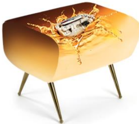
Un taburete de la colección cápsula de Seletti