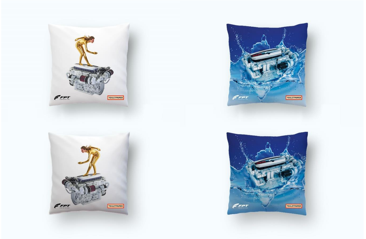
Alcuni cuscini della capsule collection di Seletti

Vivaci, innovativi, unici: questi oggetti inaugurano un nuovo percorso per FPT Industrial, che continua ad esplorare il mondo dell'arte e lo fa scegliendo come partner due artisti anticonformisti, forti e intelligenti come Maurizio Cattelan e Pierpaolo Ferrari e il loro progetto Toiletpaper, portando così una ventata di innovazione in un settore solo in apparenza lontano dall'ambiente industriale.