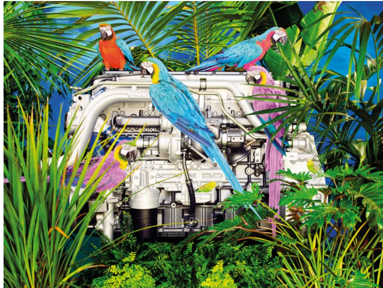
Il motore a gas naturale Cursor 13 NG interpretato da Toiletpaper in un ambiente sostenibile

NG, il motore a gas naturale più potente del Brand, in una giungla di piante, arbusti, foglie e pappagalli, come interpretazione delle caratteristiche di sostenibilità del prodotto.