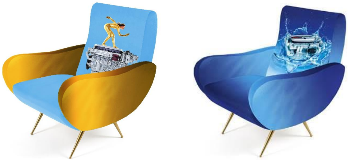
Alcune poltrone della capsule collection di Seletti

Toiletpaper di Cattelan e Ferrari è da diversi anni partner del marchio di design italiano Seletti, per cui ha realizzato oggetti di design che riuniscono il meglio dei due brand. Questa collaborazione coinvolge ora anche FPT Industrial: Seletti ha prodotto una capsule collection che ha trasformato le fotografie di Toiletpaper per FPT Industrial in oggetti di uso quotidiano. I cuscini di questa collezione speciale saranno disponibili sullo store on-line di FPT Industrial a partire da fine settembre