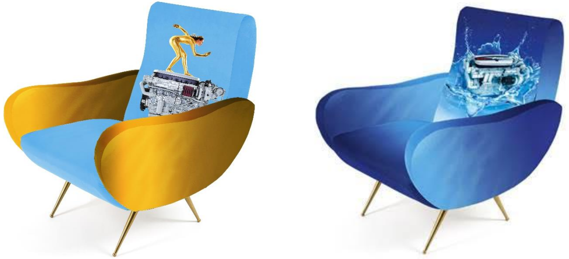
Seletti 的胶囊系列扶手椅