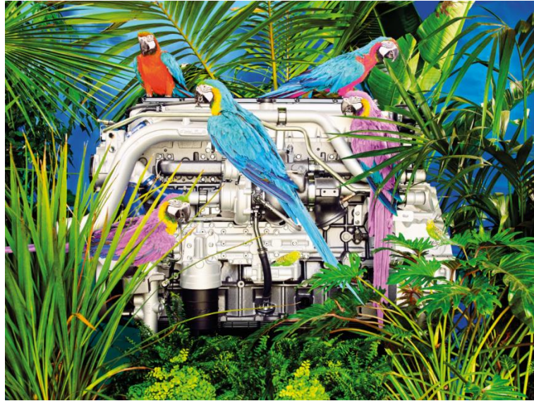
Toiletpaper 将天然气发动机 Cursor 13 NG 置于可持续环境中

Cattelan 和 Ferrari 解释说：“我们一直着迷于动力系统的动力和外形。FPT 希望我们为其最强大和最具可持续性的两款发动机进行自由创作，这是一个独特而有趣的挑战。通过 Toiletpaper 超现实的眼睛，FPT 的发动机焕发出独特的魅力：Toiletpaper 捕捉其精髓并重新加以诠释，使这些发动机成为舞台上的主角。”