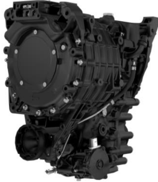
Eixo elétrico (eAxle) dianteiro eAX 300-F da FPT Industrial